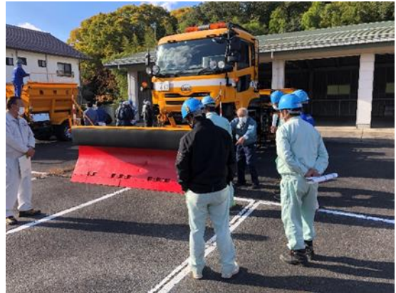
機械別実地講習状況