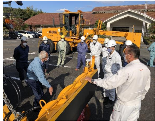
機械別実地講習状況