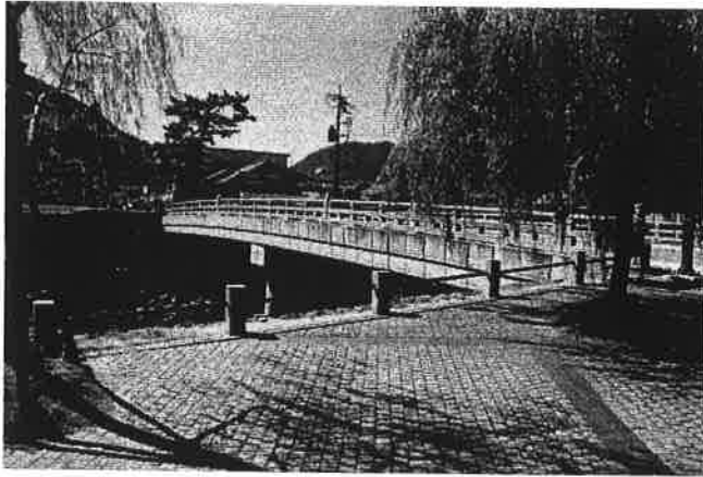
津和野大橋 (島根県)